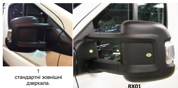
↑ стандартні зовнішні дзеркала.